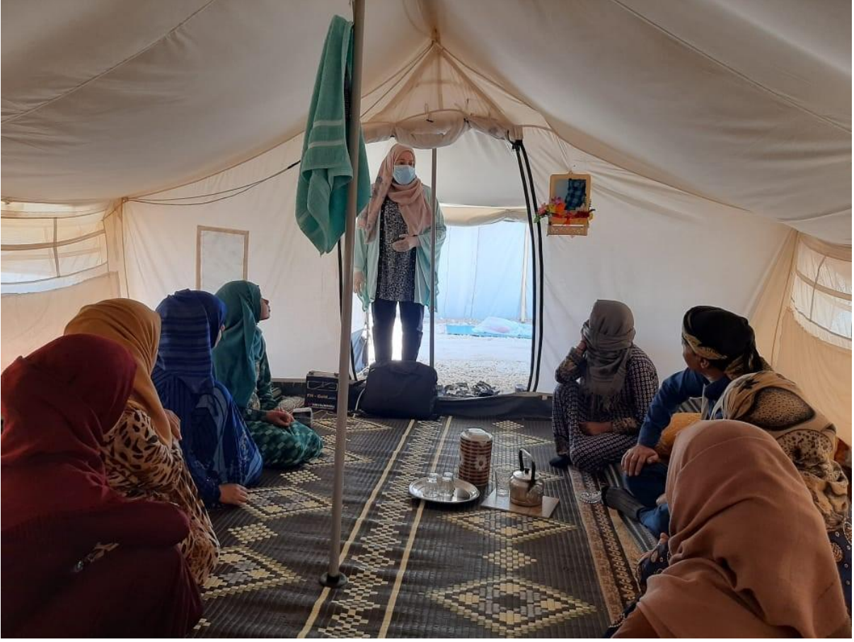
المجلس النرويجي للاجئين يعقد جلسة توعية جماعية لمجموعة المعلومات والاستشارات والمساعدة القانونية في مخيم للنازحين في شمال شرق سوريا.