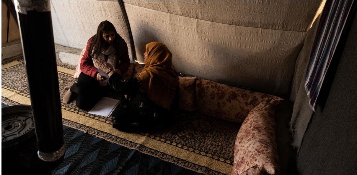
المجلس النرويجي للاجئين يقدم الدعم في التوثيق المدني للمقيمين في مخيم للنازحين في الحسكة.

وقد وصفت مناقشات مجموعة التركيز في حمص والرقه وحلب (مجموعات حضرية/ عائدة) دوماً عدم الاعتراف بالوثائق الصادرة في الخارج 2 ، وخاصة شهادات الميلاد والزواج، مما يترك الأسر عائدة جسدياً ولكنها غير مرئية قانونياً. وأفاد المشاركون بأنهم مطالبون ببدء إجراءات تسجيل جديدة أو الحصول على مصادقة قضائية، مما أدى إلى زيادة التكاليف وتعقيد الإجراءات. ورغم أن التقييم لم يقيم بشكل منهجي الإطار القانوني الذي يحكم الاعتراف بالوثائق الصادرة في الخارج، فإن النتائج النوعية تشير إلى أن التوجيه الإداري الأكثر وضوحاً وإجراءات إعادة التسجيل الأكثر اتساقاً من شأنها أن تقلل من الحواجز التي يواجهها العائدون. وأكدت مقابلات الأشخاص المفتاحيين التي تضم ممارسين قانونيين في حمص والرقه أن عمليات إعادة الإدماج نادراً ما تشمل إعادة التسجيل المدني المنهجي، وخاصة بالنسبة للأطفال المولودين خارج سوريا.