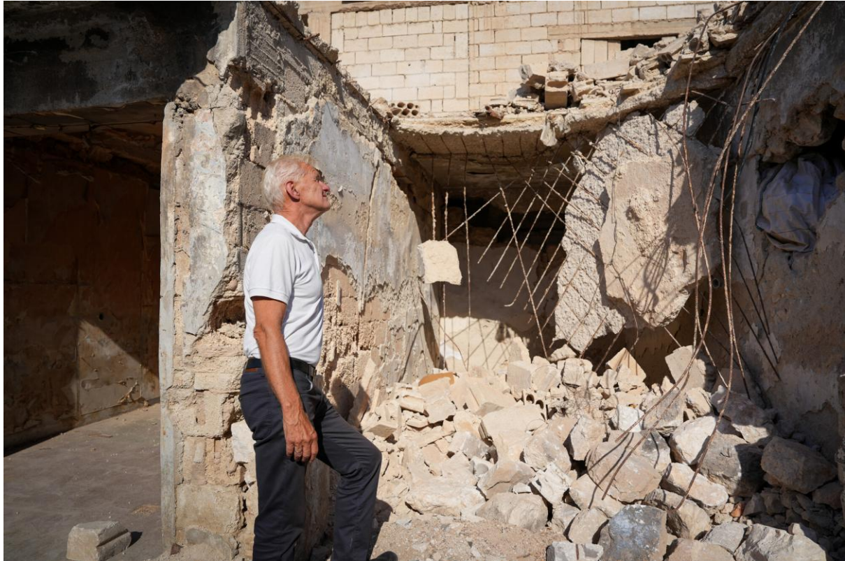
الأمين العام للمجلس النرويجي للاجئين يان إيغلاند يتفقد منزلاً مدمراً بجانب مدينة في إدلب، سوريا.

يحلل هذا القسم حقوق الوصول إلى السكن والأراضي والممتلكات عبر المحافظات التي تم تقييمها، مع التركيز على فقدان الوثائق، وانعدام أمن الحيازة، والإخلاء القسري، والاستيلاء الثانوي، والحواجز المحددة التي تواجهها الأسر التي ترأسها نساء والتي تفوقها النساء بحكم الأمر الواقع وزوجات الأشخاص المفقودين أو المختفين وغيرهم من الفئات الضعيفة. وتستند النتائج إلى بيانات متقاطعة لمسح الأسر ومناقشات مجموعة التركيز ومقابلات الأشخاص المفتاحيين والمراقبات الميدانية. وترد الجداول التفصيلية المفصلة التي تدعم هذا القسم في الملحق 4 (الجدول 11-د-13).