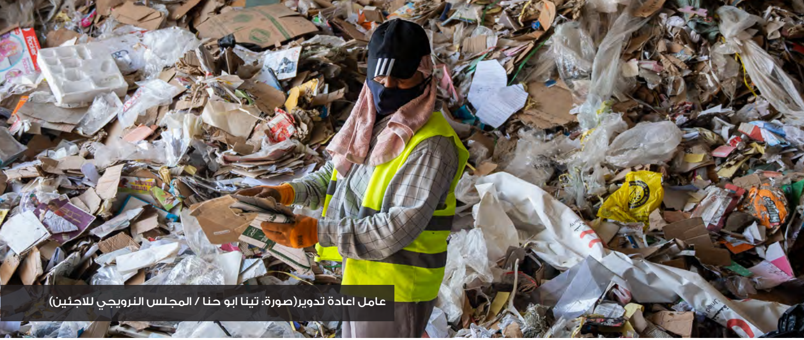
عامل إعادة تدوير