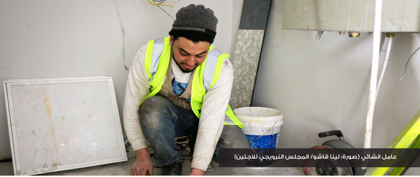
عامل انشائي