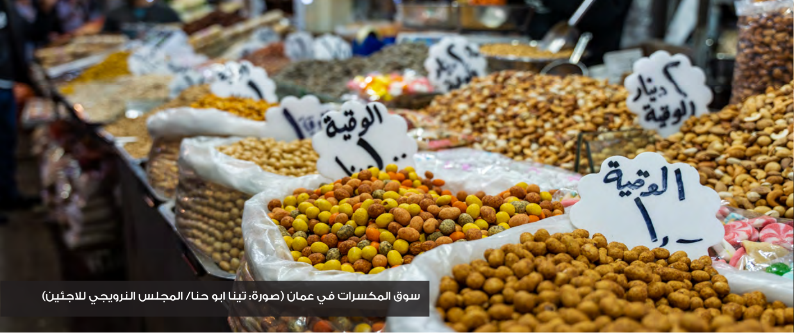
سوق المكسرات في عمان