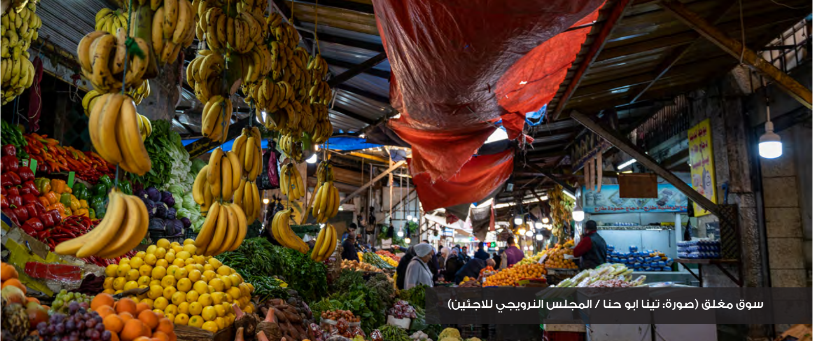
سوق مغلق