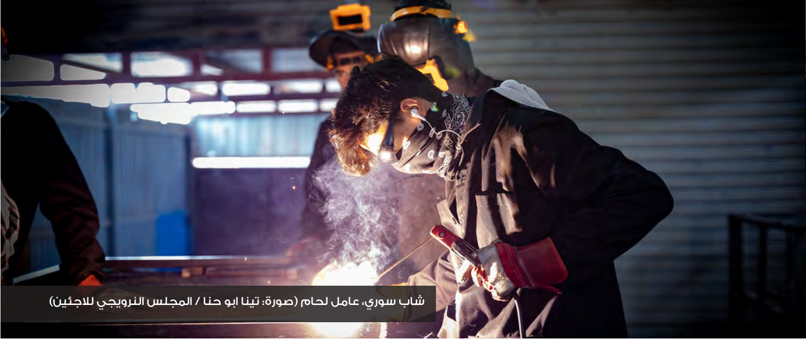
شباب سوري، عامل لحام