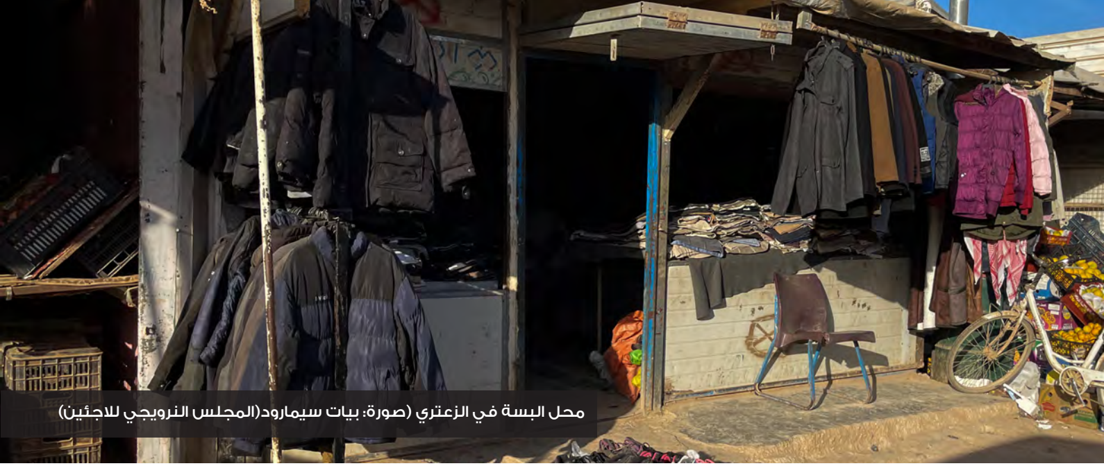
محل البسة في الزعتري