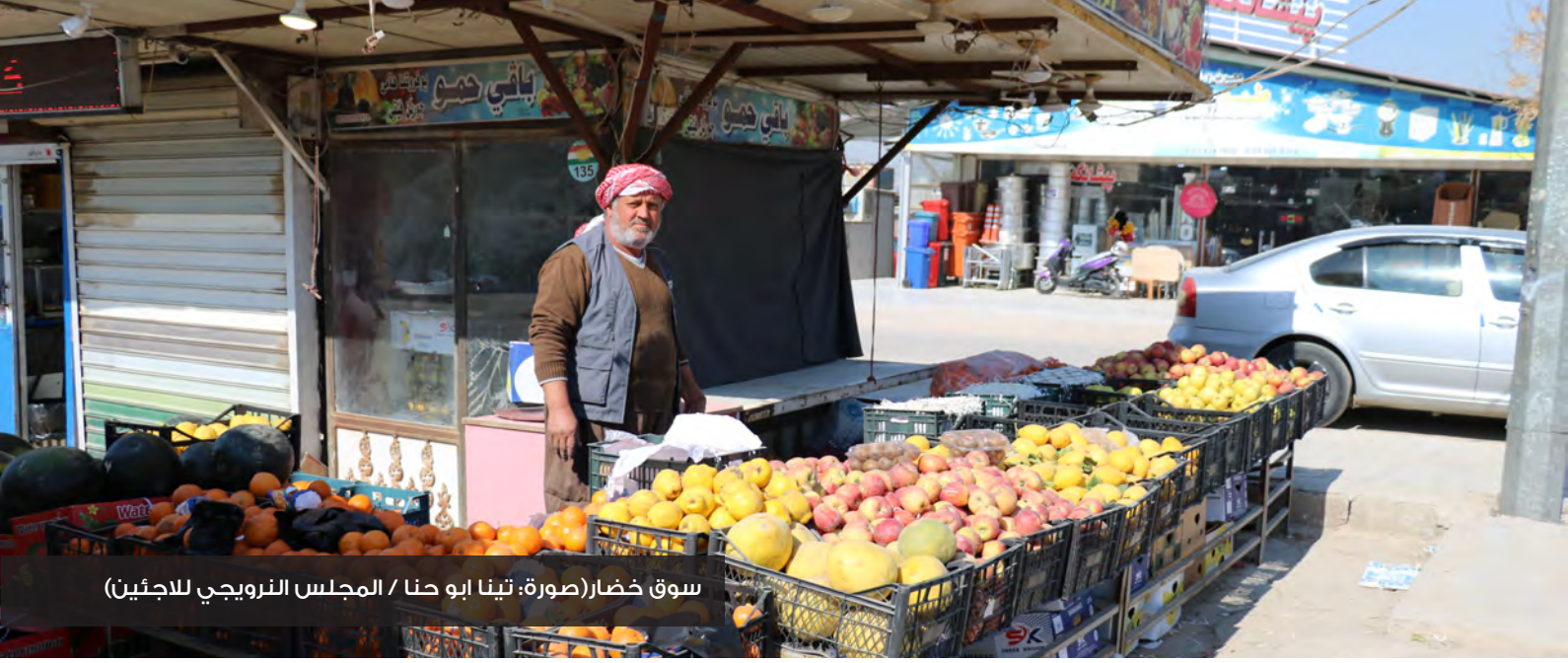
سوق خضار