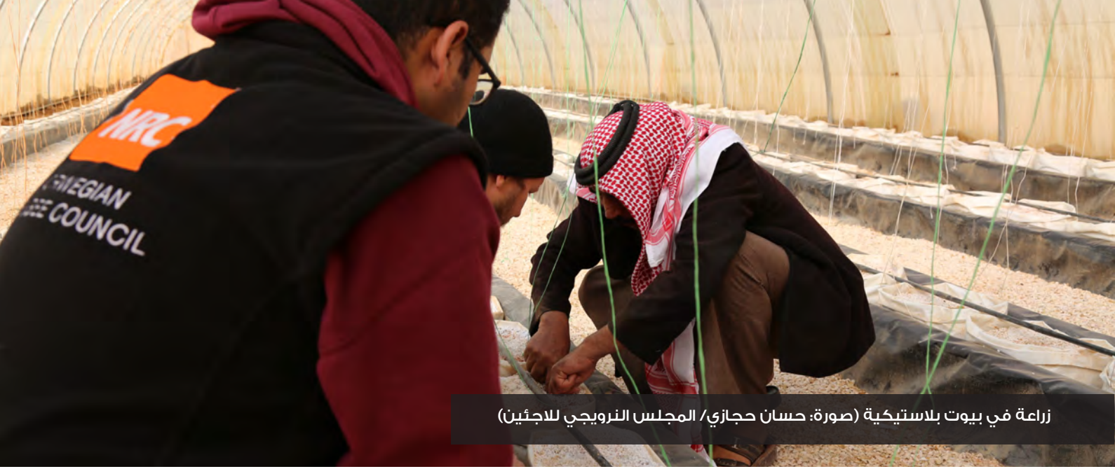
زراعة في بيوت بلاستيكية