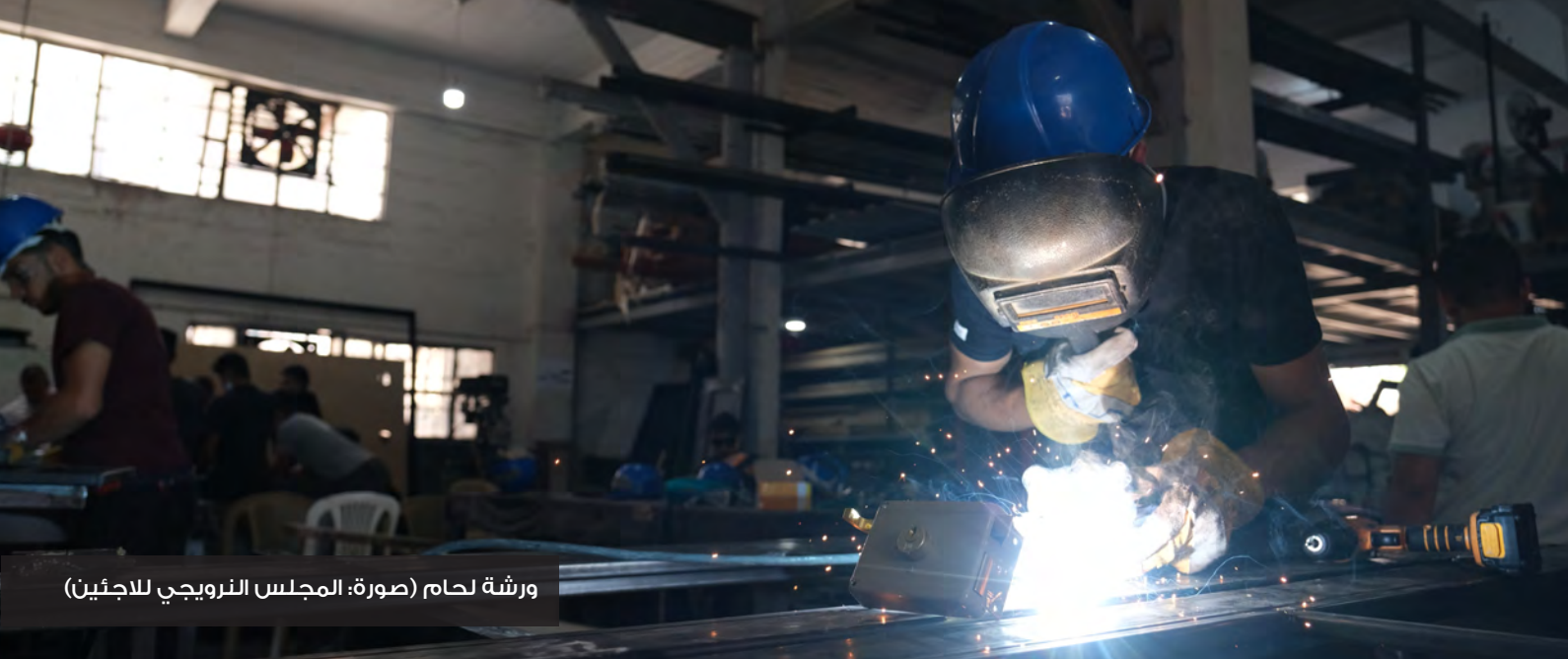
ورشة لحام